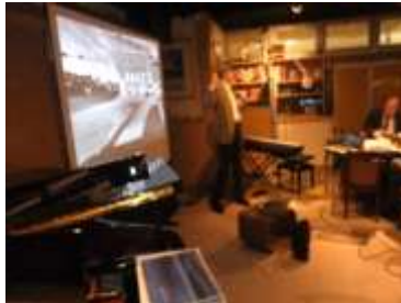
グランドピアノで、「パリの飛行機雲」