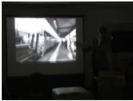
御津金川地区の写真↑