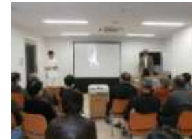
御津高校写真部員 へのクリニック

-市立金川病院のスライドショーでは、患者さん・医師・看護師の他、地元市民の方々、ボランティアの御津高校生、御津高校写真部員たちも参加してくれ会場に入りきれない程の盛況となりました。写真部員達とは特別に写真技術についてクリニックも行いました。