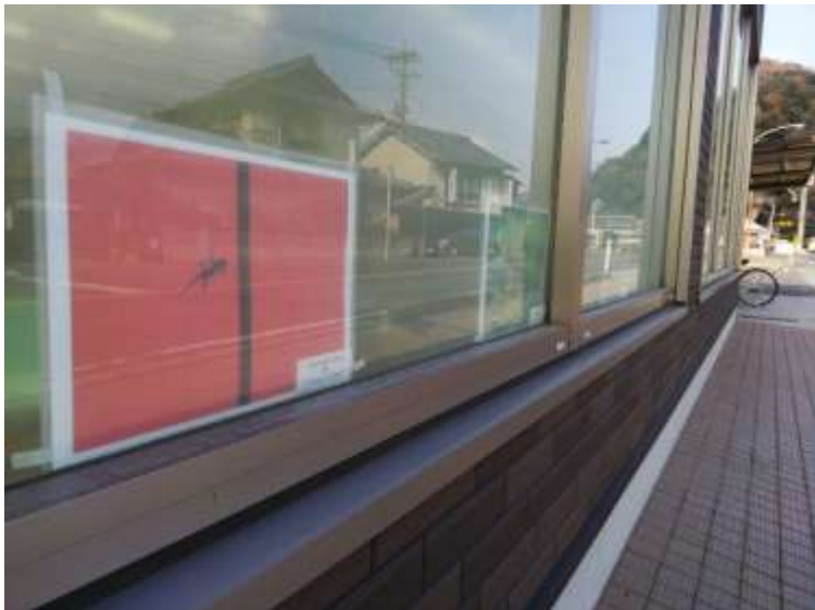
国立病院機構 岡山市立金川病院隣接 成広薬局