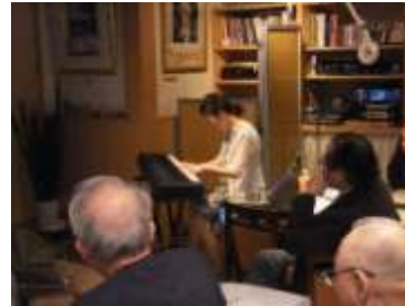
グランドピアノで「二人」