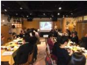
二列テーブルが並ぶディナー形式