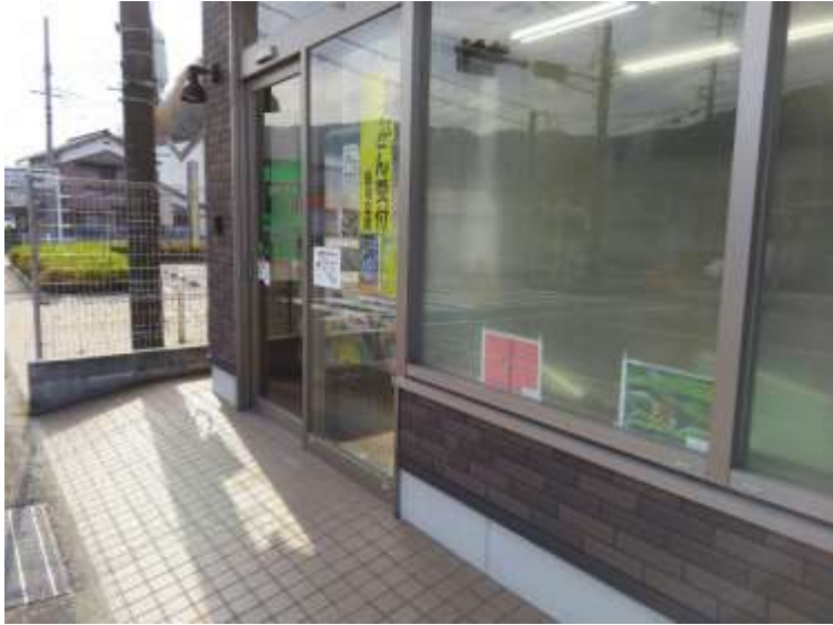
近くの小学生の通り道で、 小学生の目線で写真掲出。 小学生が騒いで見ていく んだそうです。