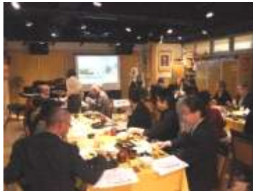
前に84インチスクリーン。4Kプロジェクターで投影。