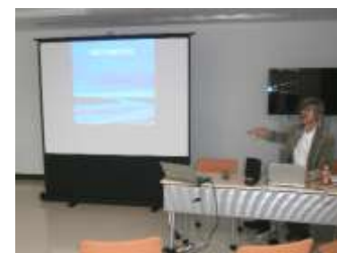
大森病院長の導入あいさつ