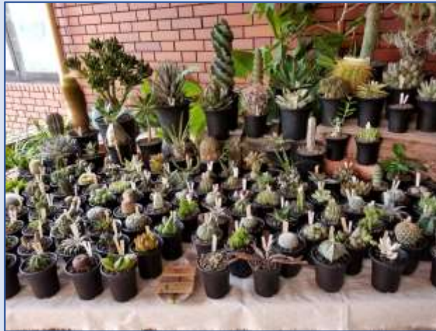
栃木のLadybirdさんの100種類超えるサボテン販売。ちっちゃいサボちゃんがかわいい。