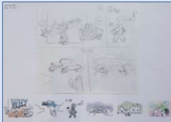
瀧口希望さんの イラスト原画 展示