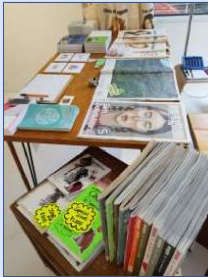
anna magazine アリゾナ増刊号タブロイド判発行 ¥300